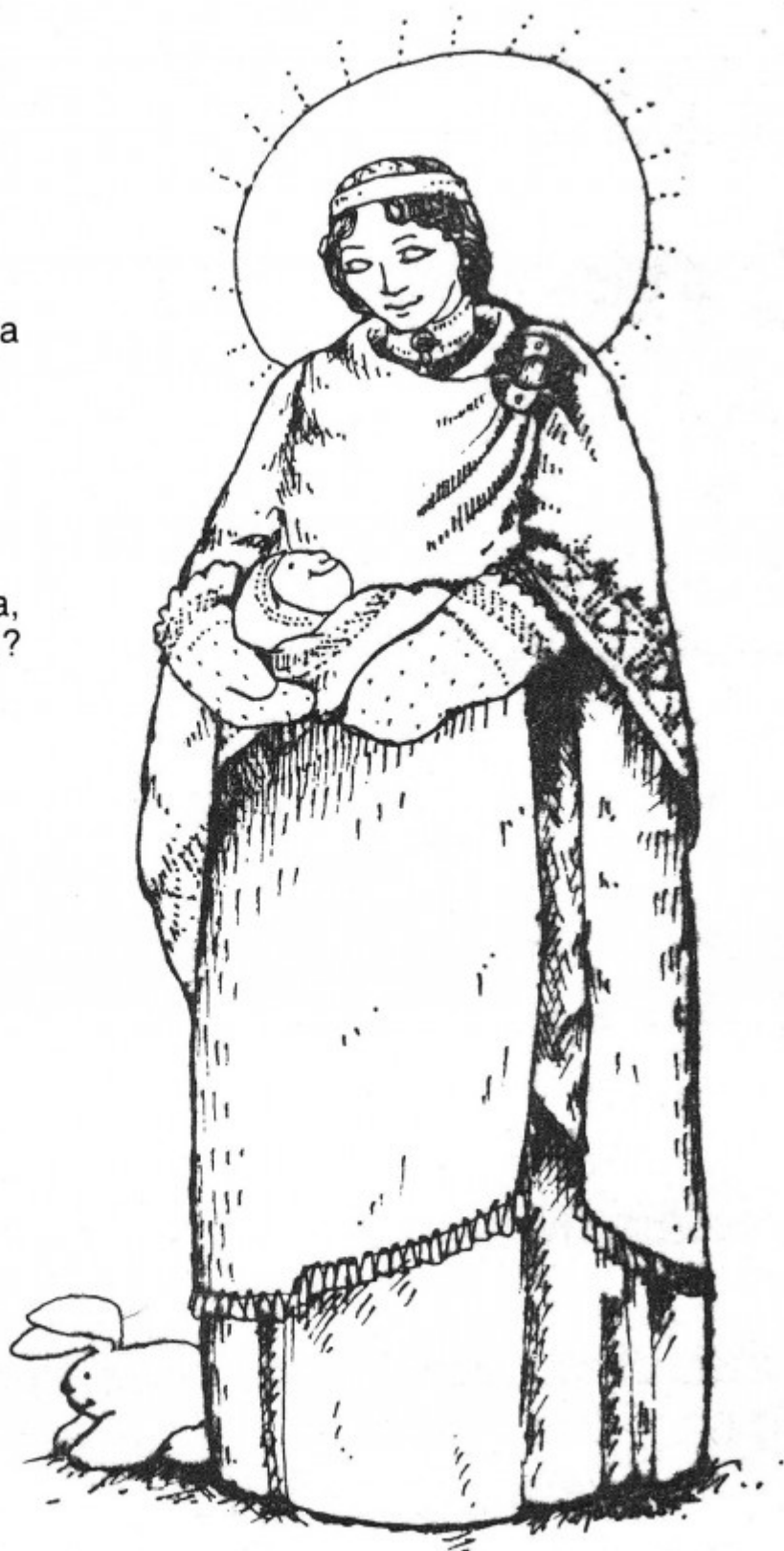
Ineses Jansones ilustrācija